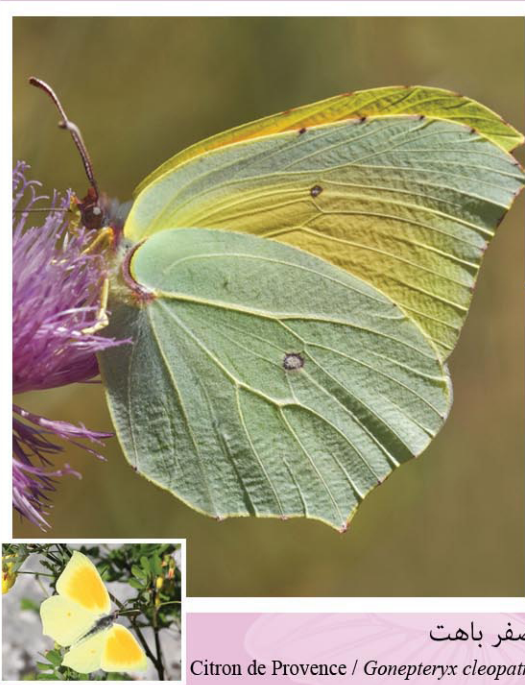
أصفر باهت Citron de Provence / Gonepteryx cleopatra

فراشة نهارية جميلة نادرة نسبيًا نتيجة للاستعمال المفرط للمبيدات الحشرية، يتراوح مدى أجنحتها بين 50 و68 مم. يختص الذكر بلون أصفر ناصع وبقعة كبيرة برتقالية ناصعة في مستوى الأجنحة الأمامية. الأنثى بيضاء مخضرة مع بقعة برتقالية على كل جناح تظهر بين مارس وسبتمبر في الغابات والأحراج المكشوفة والهضاب والمروج المزهرة حيث ترعى الرحيق الذي توفره عذة أنواع من الأزهار البرية. يرعى اليسروع البليحاء والدفلى. تقضي هذه الحشرة الشتاء داخل التجاويف والشقوق وتحت الشجيرات الكثيفة والأوراق الجافة.