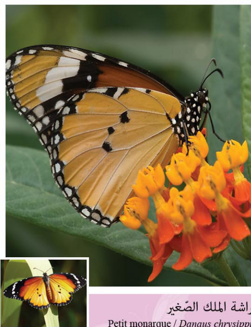
فراشة الملك الصّغير Petit monarque / Danaus chrysippus

فراشة نهارية جميلة، ذات لون برتقالي فاتح يحده طرف كستنائي. يتراوح مدى أجنحتها بين 69 و81 مم. الذكر والأنثى متشابهان. تظهر ببلادنا بين شهري جوان وأكتوبر في الغابات والأحراج والمناطق الساحلية وأطراف السبخ. تطير بسرعة وأحيانًا على ارتفاع محترم بحثًا عن رحيق الأزهار البرية مثل البكّ والحزينة.