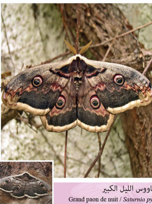
طاووس الليل الكبير Grand paon de nuit / Saturnia pyri

فراشة نهارية جميلة نادرة نسبيًا نتيجة للاستعمال المفرط للمبيدات الحشرية، يتراوح مدى أجنحتها بين 50 و68 مم. يختص الذكر بلون أصفر ناصع وبقعة كبيرة برتقالية ناصعة في مستوى الأجنحة الأمامية. الأنثى بيضاء مخضرة مع بقعة برتقالية على كل جناح تظهر بين مارس وسبتمبر في الغابات والأحراج المكشوفة والهضاب والمروج المزهرة حيث ترعى الرحيق الذي توفره عذة أنواع من الأزهار البرية. يرعى اليسروع البليحاء والدفلى. تقضي هذه الحشرة الشتاء داخل التجاويف والشقوق وتحت الشجيرات الكثيفة والأوراق الجافة.