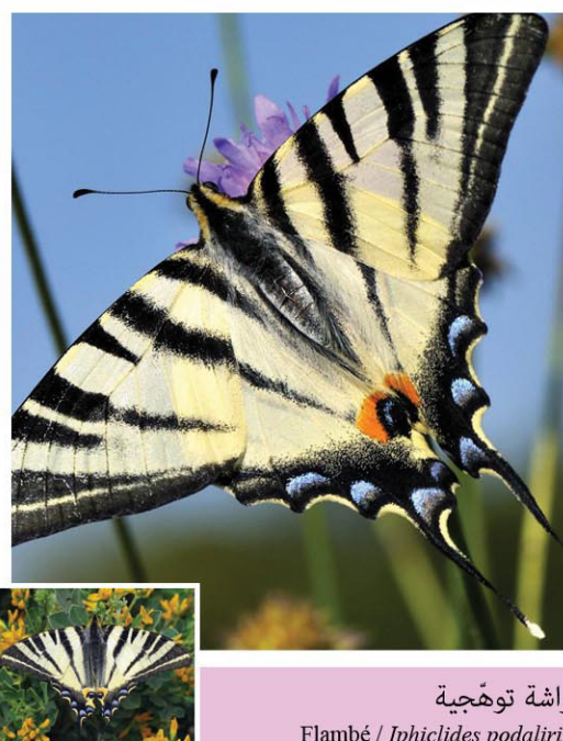
فراشة توهّجية Flambe / Iphiclides podalirius

فراشة نهارية نادرة من أجل ما يوجد ببلادنا، يتراوح مدى أجنحتها بين 64 - 80 مم (الأنثى أكبر حجمًا من الذكر). تظهر بين ماي وأوت في الفجوات الغابية والأحراج غير الكثيفة والمروج حيث ترعى بصفة خاصة أزهار شجيرات الزعرور والخلنج. تعرف من بعيد من خلال طيرانها الهادئ والمتموج. يتغذى اليسروع من البرقوق الشائع.