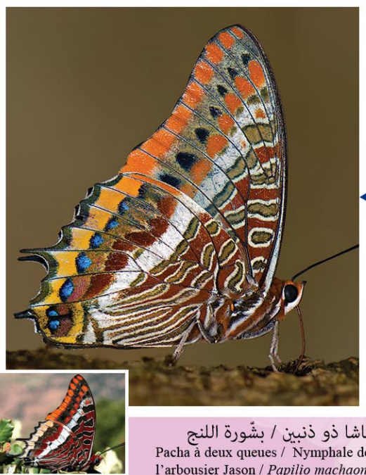
باشا ذو ذنين / بشّورة اللنج Pacha à deux queues / Nymphale de l'arbusier Jason / Papilio machaon

فراشة نهارية جميلة وشائعة نسبيًا ببلادنا، يتراوح مدى أجنحتها بين 70 و95 مم. الأنثى أكبر حجمًا من الذكر. يكسو الوجه العلوي للأجنحة لون بني أصهب داكن، مع وجود أطراف برتقالية بنية. تحمل مؤخرة الأجنحة الخلفية بقع زرقاء. تظهر بين شهري ماي وجوان وبصفة أقل بين سبتمبر وأكتوبر، في الغابات والأحراج والحدائق والمناطق الفلاحية، حيث تمتص عصارة الغلال والثمار الغابية في طور التعفن. يقاتل اليسروع أساسًا من شجرة اللنج.