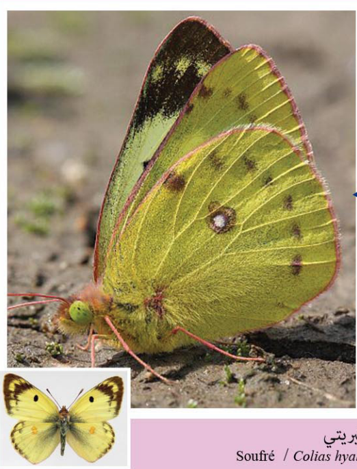
كبريتي Soufré / Colias hyale

فراشة نهارية نادرة نسبيًا، ذات أجنحة صفراء شاحبة لدى الذكر وبضء لدى الأنثى. يتميز الجنسان بجوانب سوداء في مستوى الأجنحة الأمامية ولون أصفر لأسفل الأجنحة مع وجود بقعة بيضاء. يتراوح مدى أجنحتها بين 42 و50 مم. يلازم الكبريتي المناطق المزهرة حيث يرعى النباتات البرية خصوصا منها النفل . تظهر هذه الفراشة ببلادنا خلال فترتين : أفريل - جوان وأوت - أكتوبر، ويمكن مشاهدتها بالغابات والمروج والأحراج والحدائق العمومية والمنتزهات.