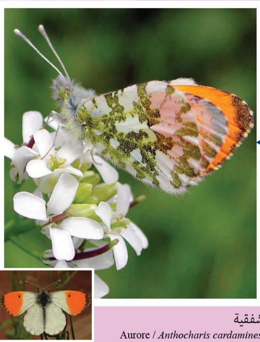
شفقية Aurore / Anthocharis cardamines

فراشة نهارية نادرة نسبيًا، يتراوح مدى أجنحتها بين 38 و48 مم. الوجه العلوي للأجنحة أبيض مع طرف أسود وبقعة برتقالية عريضة في مستوى الجناح الأمامي لدى الذكر. الوجه السفلي للأجنحة أبيض مع رسوم مخضرة. تظهر بين شهري مارس وجويلية بالغابات المكشوفة والمروج المزهرة والحدائق حيث ترعى الأزهار البرية. يقاتل اليسروع من الصناب والسحارة (الفجل البري).